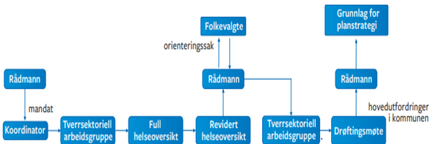
Figur 1. Eksempel på planprosess.

Folkehelse, klima- og miljø og god medverknad dannar grunnlag for all planlegging. I tabellen under ligg føringane og system for prosessen